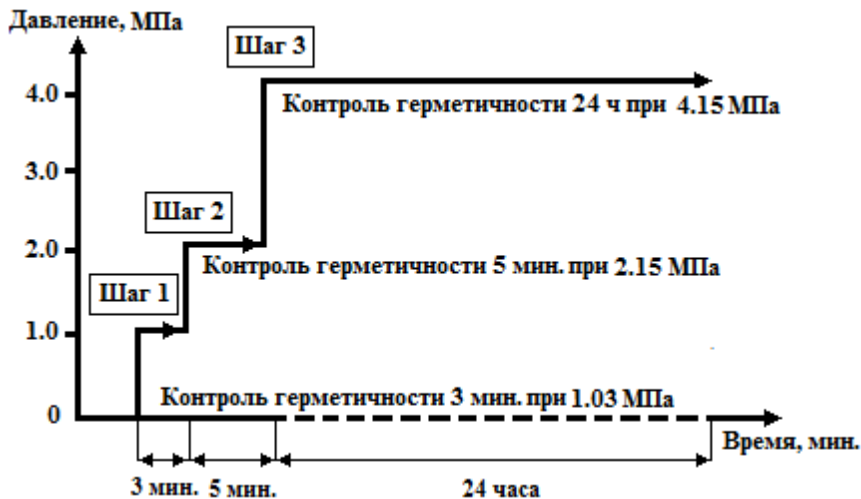
Рисунок 2 - Проверка герметичности азотом хладагента R 410A

5.5.6 Неплотности допустимо выявлять путем обмыливания медных труб, их разъемных соединений с испарительным блоком и компрессорно-конденсаторным блоком, а также паяных неразъемных соединений медных труб мыльной пеной с добавкой глицерина и последующим наблюдением за появлением пузырьков в местах неплотностей.